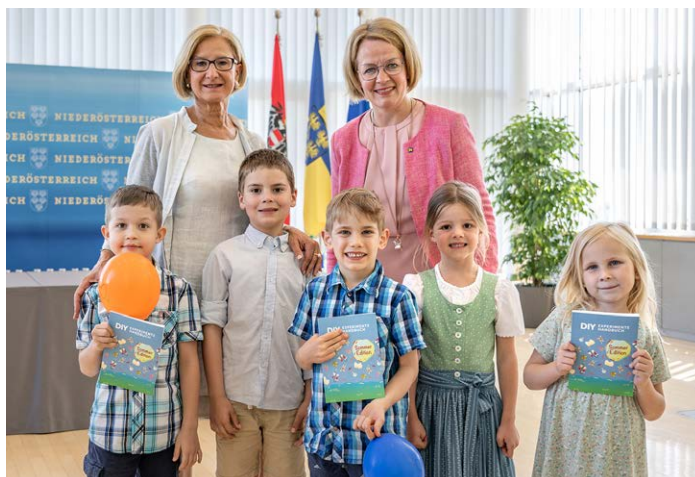
Landeshauptfrau Johanna Mikl-Leitner und Landesrätin Christiane Teschl-Hofmeister mit Kindern und dem „DIY Experimente Handbuch Sommer Edition“.

In den Sommermonaten und in den Ferien bleibt oft ein bisschen mehr Zeit, um Spannendes zu erleben und tolle Plätze zu erkunden. Wissenschaft und Freizeit lassen sich ideal miteinander kombinieren und für Kinder, Jugendliche und Familien stellt das Land Niederösterreich ein tolles Angebot für die Sommerferien vor: Das beliebte Do-it-yourself (DIY) Experimente-Handbuch ist ab sofort in einer Sommer-Edition verfügbar.