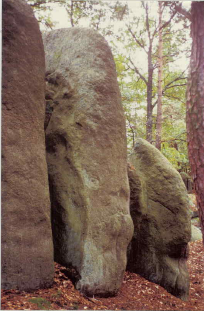
SÜDTEIL DER HAUPTGRUPPE AUS WESTEN