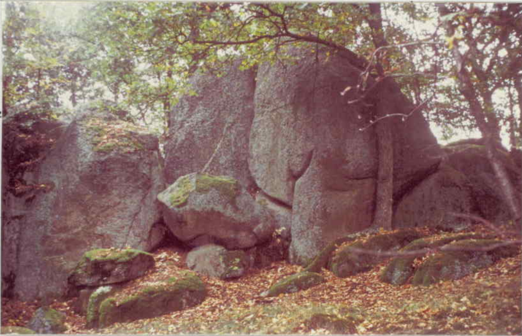
NEBENGRUPPE IM OSTEN (GIPFEL DER KUPPE) AUS NORD-NORDWEST