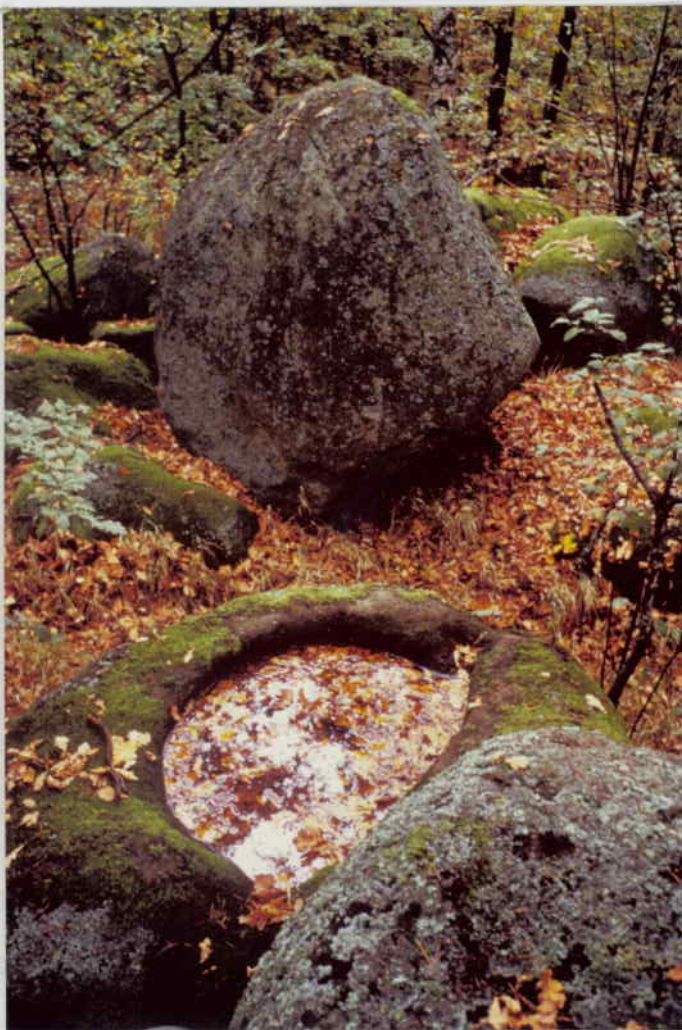
SCHALENSTEIN IN DER ÖSTL. NEBENGRUPPE (SCHALE: 80/120 cm)