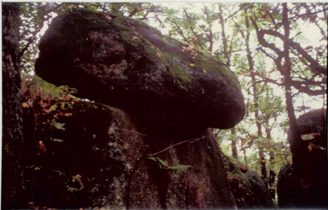
ÖSTICHE NEBENGRUPPE PILZARTIG AUFGELEGENER FELS (AUS SÜDEN)