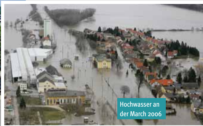
Hochwasser an der March 2006

plänen ist Aufgabe der Gemeinden. Dabei dürfen in Bereichen, die bei 100-jährlichen Hochwässern überflutet werden, keine Neuwidmungen von Bauland erfolgen. Bei gewidmeten, aber noch unbebauten Flächen ist eine Bausperre zu erlassen und eine Rückwidmung durchzuführen, wenn nicht innerhalb von fünf Jahren ein Hochwasserschutzprojekt umgesetzt werden kann. Sinngemäß gilt dies auch für rote und gelbe Zonen der Gefahrenzonenpläne.