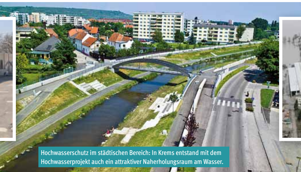
Hochwasserschutz im städtischen Bereich: In Krems entstand mit dem Hochwasserprojekt auch ein attraktiver Naherholungsraum am Wasser.