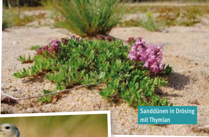
Sanddünen in Drösing mit Thymian