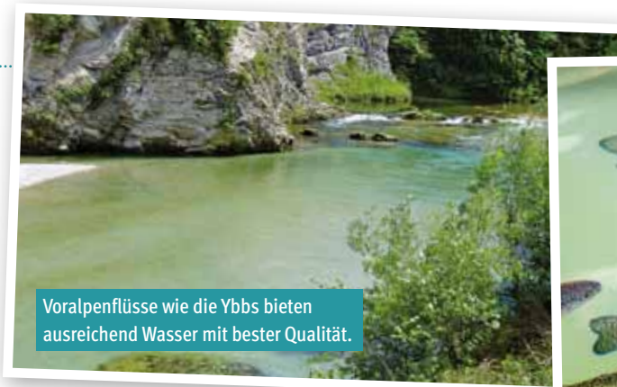
Voralpenflüsse wie die Ybbs bieten ausreichend Wasser mit bester Qualität.