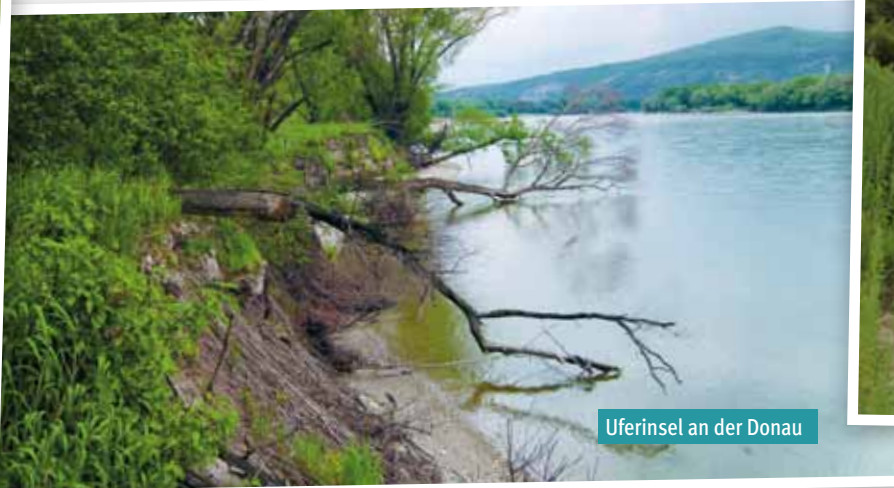
Uferinsel an der Donau