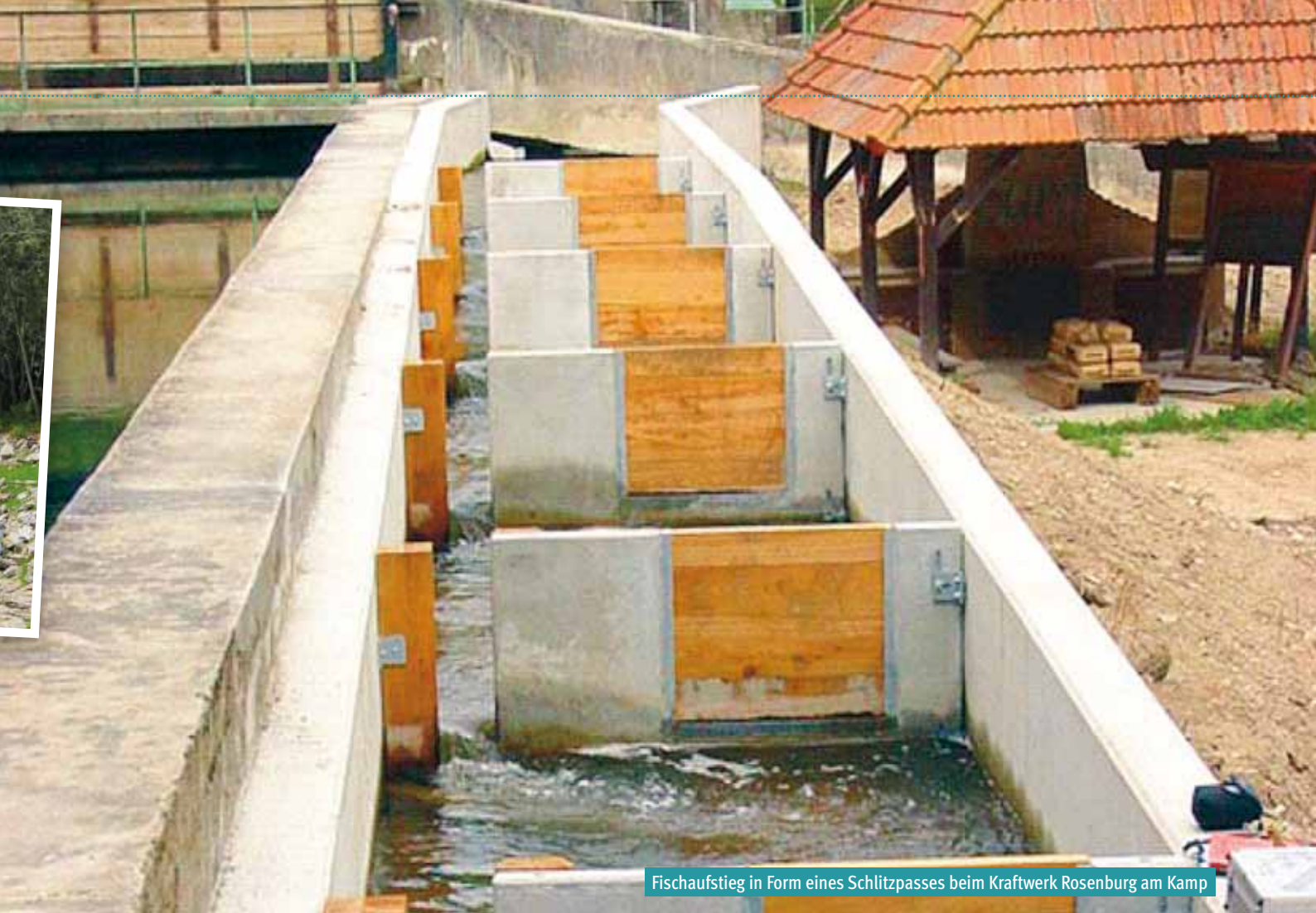
Fischaufstieg in Form eines Schlitzpasses beim Kraftwerk Rosenberg am Kamp

anlagen und Sohlswellen zerstückeln den Lebensraum der Fische. Wichtige Laichgebiete, Wintereinstellplätze oder Nahrungsgebiete können von den Fischen nicht mehr genutzt werden. In Niederösterreich bestehen auf etwa 7.800 km Gewässerstrecke rd. 5.300 künstliche Querbauwerke, die als Wanderhindernis wirken.