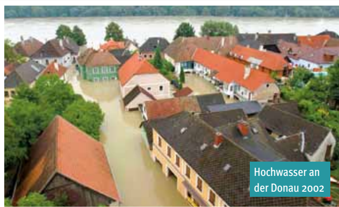
Hochwasser an der Donau 2002