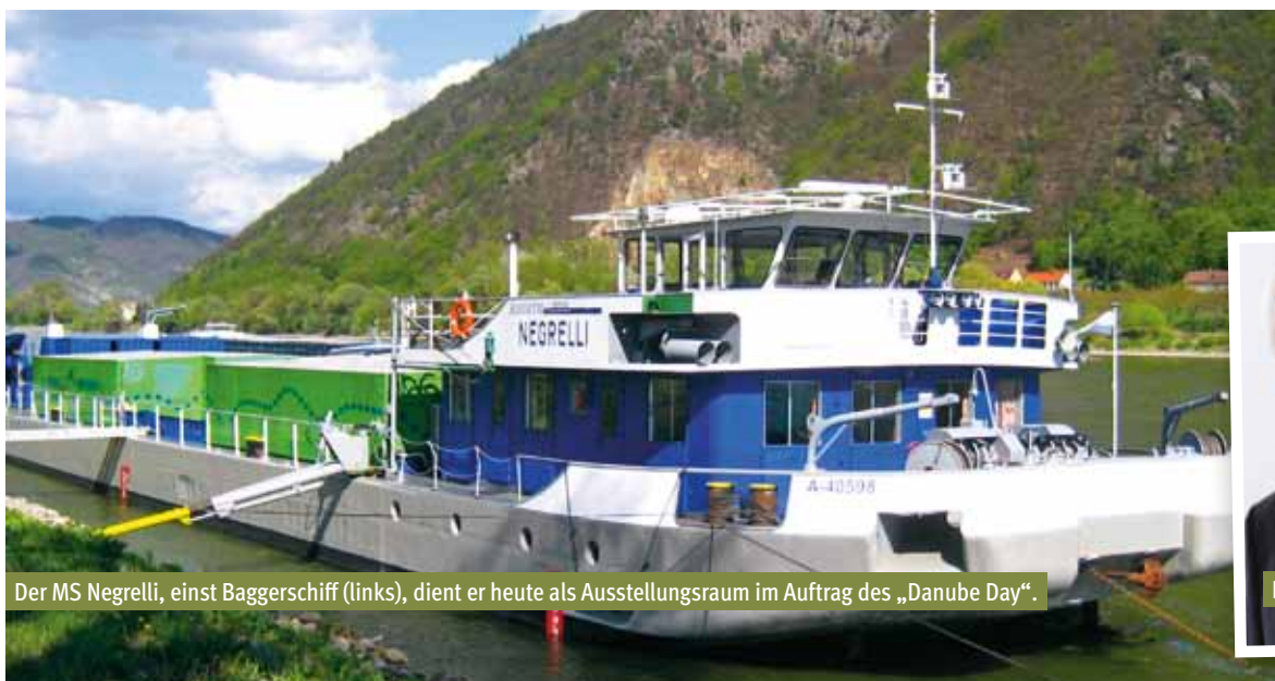
Der MS Negrelli, einst Baggerschiff (links), dient er heute als Ausstellungsraum im Auftrag des „Danube Day“.