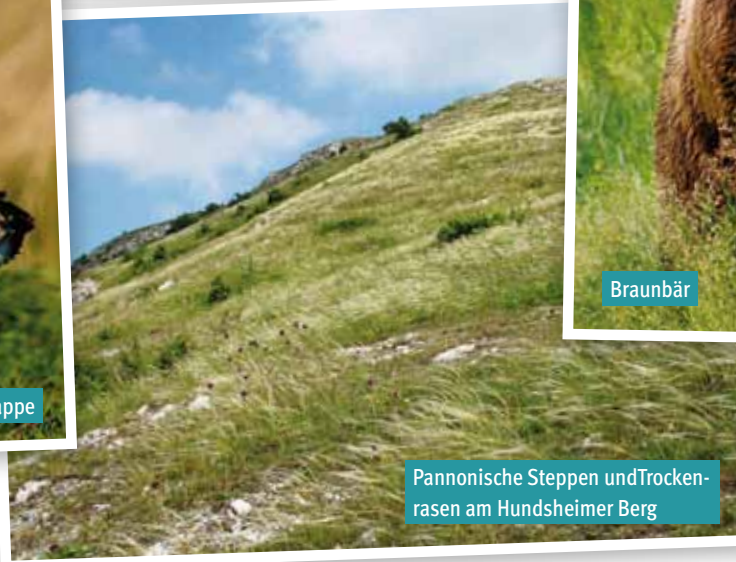
Pannonische Steppen und Trockenrasen am Hundsheimer Berg