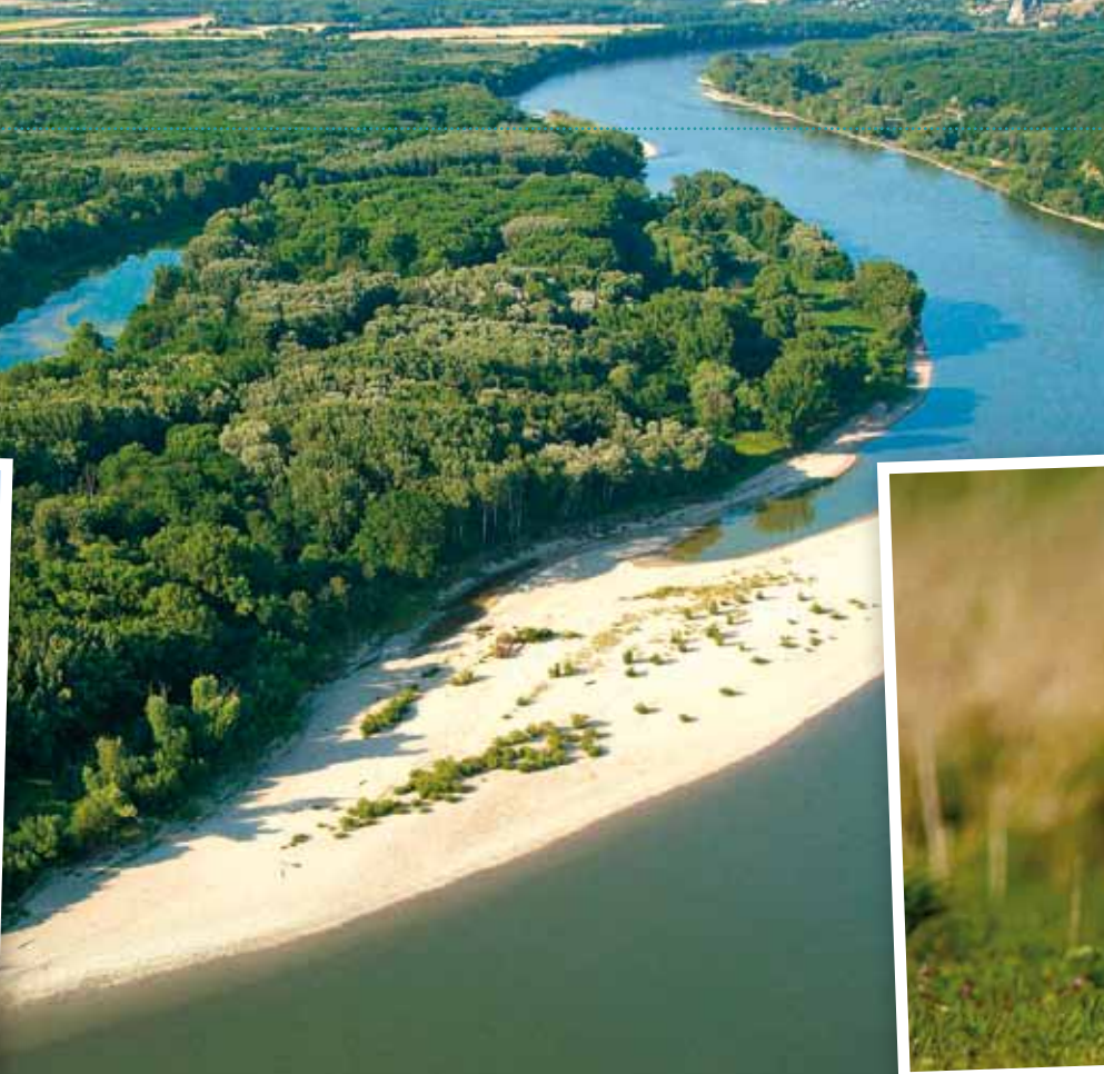
Donauau bei Hainburg