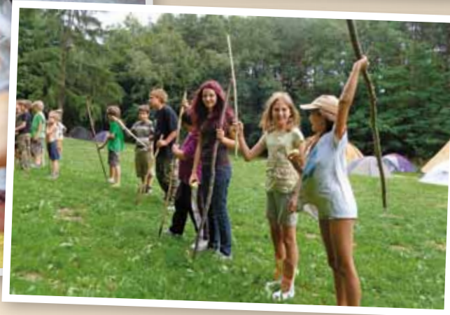
Lagerfeuer, Bogenschnitzen, unter freiem Himmel nächtigen, sind nur einige der Aktivitäten eines Wildniscamps.

Systemen und das Entwickeln einer emotionalen Verbundenheit zwischen Mensch und Natur. Die Tiefe der Naturverbundenheit und das bedeutungsvolle Eingebundensein fördern auch einen nachhaltigen Lebensstil. Wildnispädagogik wendet sich, unabhängig von großen Nationalpark- und Naturschutz-Projekten, direkt an die fließenden Übergänge zwischen Zivilisation, Kulturland und Wildnis. Es geht einfach auch darum, die „kleine Wildnis“ vor der eigenen Haustür wieder zu entdecken.