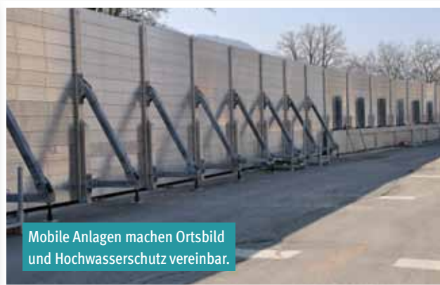
Mobile Anlagen machen Ortsbild und Hochwasserschutz vereinbar.