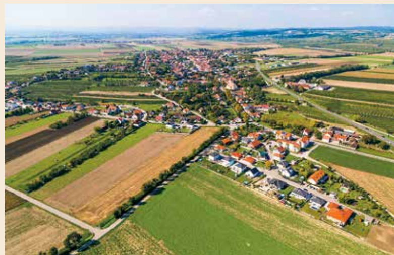
Konsequenter Klima- und Bodenschutz brachte Fels am Wagram eine ÖGUT-Umweltpreis-Auszeichnung.