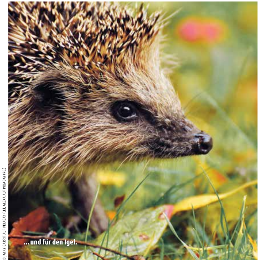
... und für den Igel.