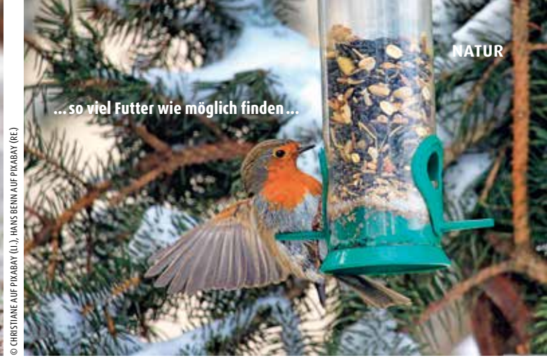
...so viel Futter wie möglich finden...