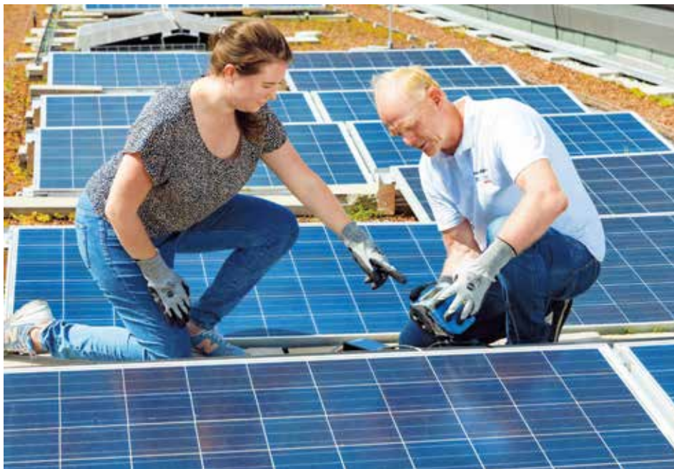
PV-Anlagen auf unseren Dächern werden bereits heute zu einem gewohnten Bild. Am Foto Forschende von PV Austria.

Österreich von Klimakrise hart getroffen. Ein dekarbonisiertes Energiesystem trägt auch zur Lösung einer der größten gesellschaftlichen Herausforderungen bei: der Klimakrise. Sie bedroht unsere Lebensgrundlagen, ihre Auswirkungen sind deutlich spürbar und menschengemacht. 13 der 14 wärmsten Jahre aus fast 140 Jahren Messgeschichte traten nach dem Jahr 2000 ein. Der Anstieg der Durchschnittstemperaturen trifft Kontinentaleuropa und damit auch Österreich besonders hart. Extreme Wetterereignisse werden immer häufiger. Die Bundesregierung hat sich daher vorgenommen,