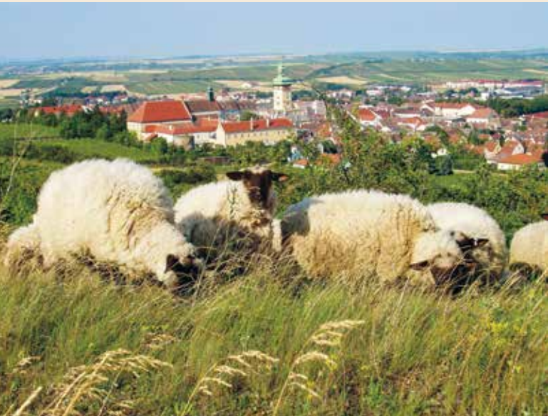
Die KLAR! Region Retzerland (im Bild) und Böheimkirchen haben sich mit ihren ökologischen Projekten für das Voting qualifiziert.