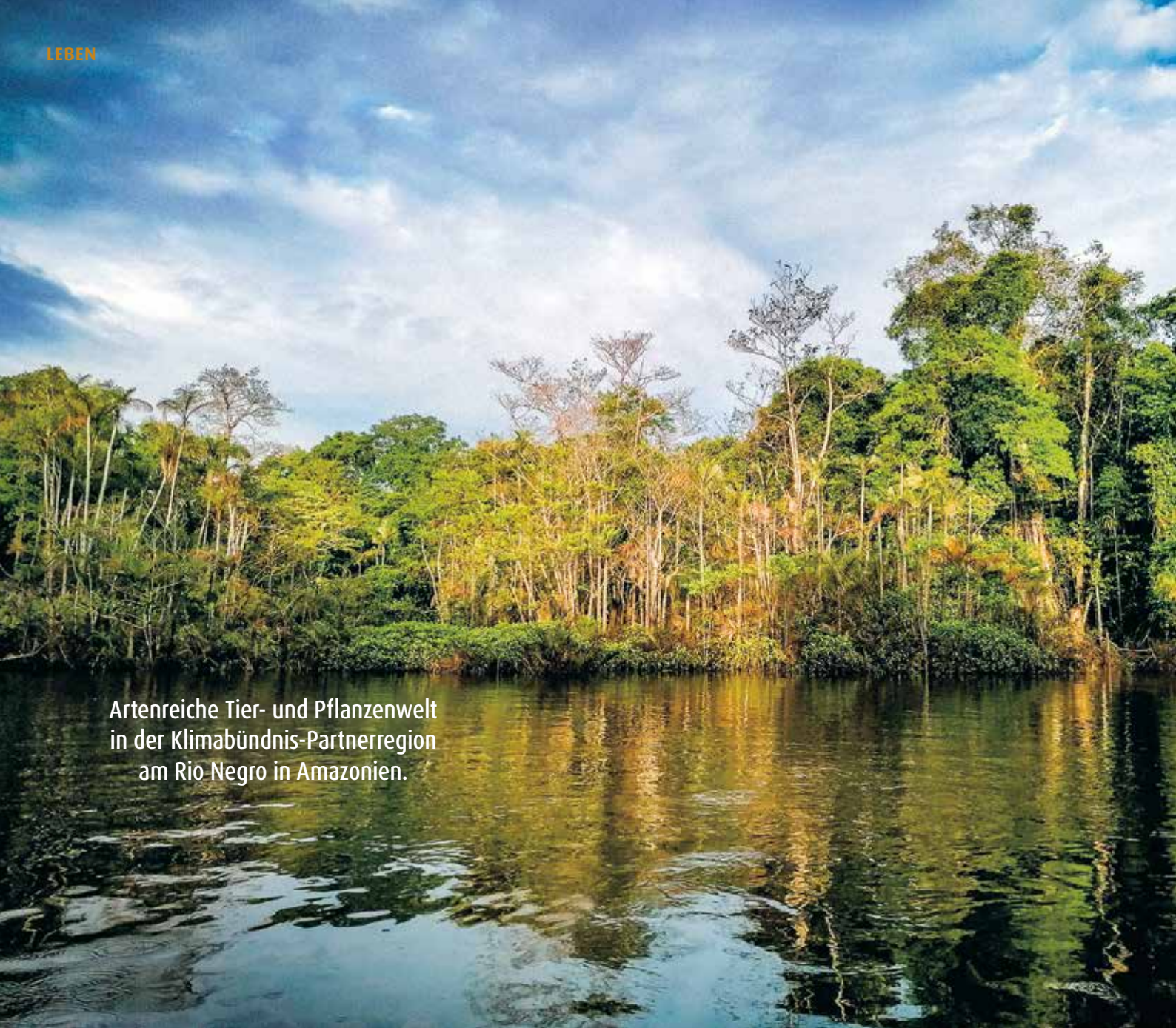
Artenreiche Tier- und Pflanzenwelt in der Klimabündnis-Partnerregion am Rio Negro in Amazonien.