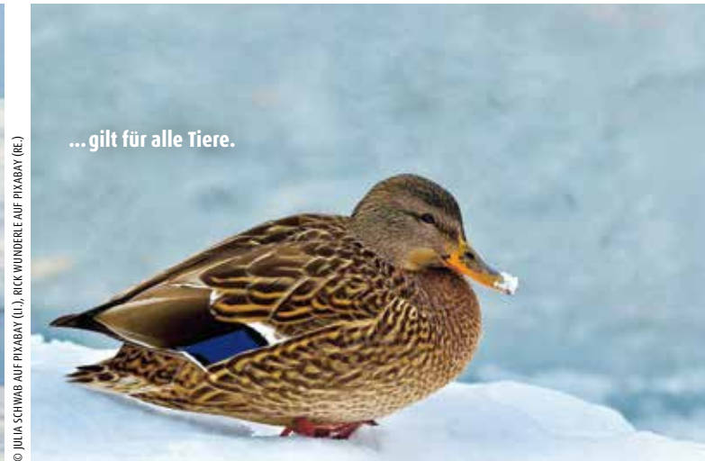
... gilt für alle Tiere.