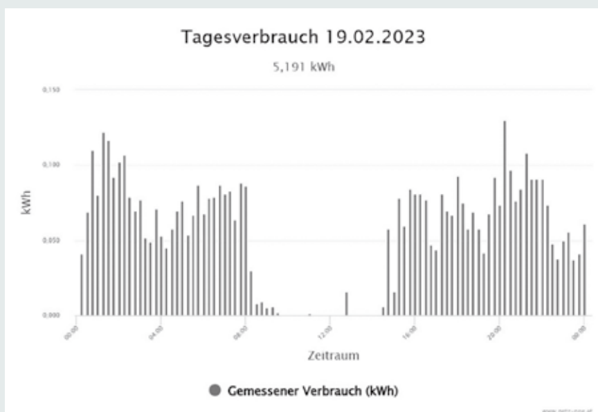
Der Smart Meter zeigt den Stromverbrauch im Detail.

Ewalds Erkenntnisse. In der Grafik erkennt man den gemessenen Verbrauch vom 29. 1. 2023 – ein Sonntag, an dem Ewalds PV-Anlage aufgrund des Schnees keinen Strom erzeugte. Die kleinen Balken zwischen Mitternacht und 8.00 Uhr zeigen die „Grundlast des Hauses“ – also Standby-Verbräuche und Stromverbraucher, die immer in Betrieb sind. Der erste „größere“ Verbrauch zeigt sich durch die Kaffeemaschine ab 8.00 Uhr morgens. Das Kochen zwischen 10.30 und 12.00 Uhr ist abgebildet und ab 13.00 Uhr war der Geschirrspüler in Betrieb. Der Trocknungsvorgang des Geschirrspülers um 14.30 Uhr ist eine weitere Verbrauchsspitze, gegen 16.00 Uhr wurde nochmal Kaffee gemacht. Ab 19.00 Uhr kommen noch die Verbräuche des Fernsehers zur Grundlast.