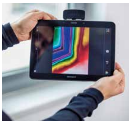
Eine Wärmebildkamera zeigt die Schwachstellen.

Dämmen: Gegen Kälte und Hitze. Familie L. fragt bei der Energieberatung NÖ um Rat an, da Renovierungsarbeiten an der Fassade des aus 1990 stammenden Einfamilienhauses geplant sind. Der Einreichplan zeigt, dass an den Außenwänden zwar eine Dämmung angebracht ist, die Dämmstärke entsprechend dem damaligen Baustandard jedoch nicht optimal ist. Wenn nun aufgrund der Fassadenrenovierung ohnehin Malerarbeiten anstehen, sollte das Gerüst gleich auch für eine Erneuerung der Dämmung genutzt werden. Die Energieberatung rät: Am