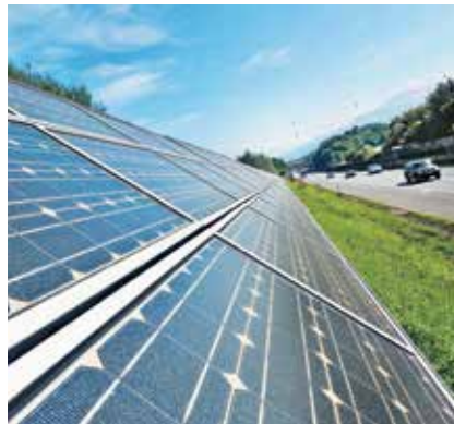
Solarpaneele an der Lärmschutzwand.

Mit der Kraft des Wassers. Der Ausbau Erneuerbarer Energieträger ist und bleibt ein wichtiges Thema. Die ASFINAG nutzt dabei die eigene „Infrastruktur“, so wurde z. B. im Oktober letzten Jahres am Semmering zwischen Mürzzuschlag und Ternitz ein Kleinwasserkraftwerk in Betrieb genommen, das rund 490 Megawattstunden (MWh) Strom jährlich und damit nicht ganz die Hälfte des Energieverbrauchs des längsten Tunnels auf der Semmering Schnellstraße (S6) produziert. Im Tunnel braucht man Energie, um u. a. die Beleuchtung und Sicherheitstechnik bereitzustellen. Das Wasser kommt vom Berg und wurde bisher ohne Nutzen einfach abgeleitet. Bis zu 200 Liter pro Sekunde stehen zur Verfügung, natürlich abhängig vom Niederschlag. Jetzt wird das Wasser gesammelt und über eine Druckrohrleitung in das tiefer gelegene Kleinkraftwerk transportiert. Durch die Fallhöhe von gut 120 Metern wird die Turbine angetrieben und Energie erzeugt. In Flirsch in Tirol besteht bereits ein weiteres Kraftwerk und noch eines soll für den Karawankentunnel entstehen.