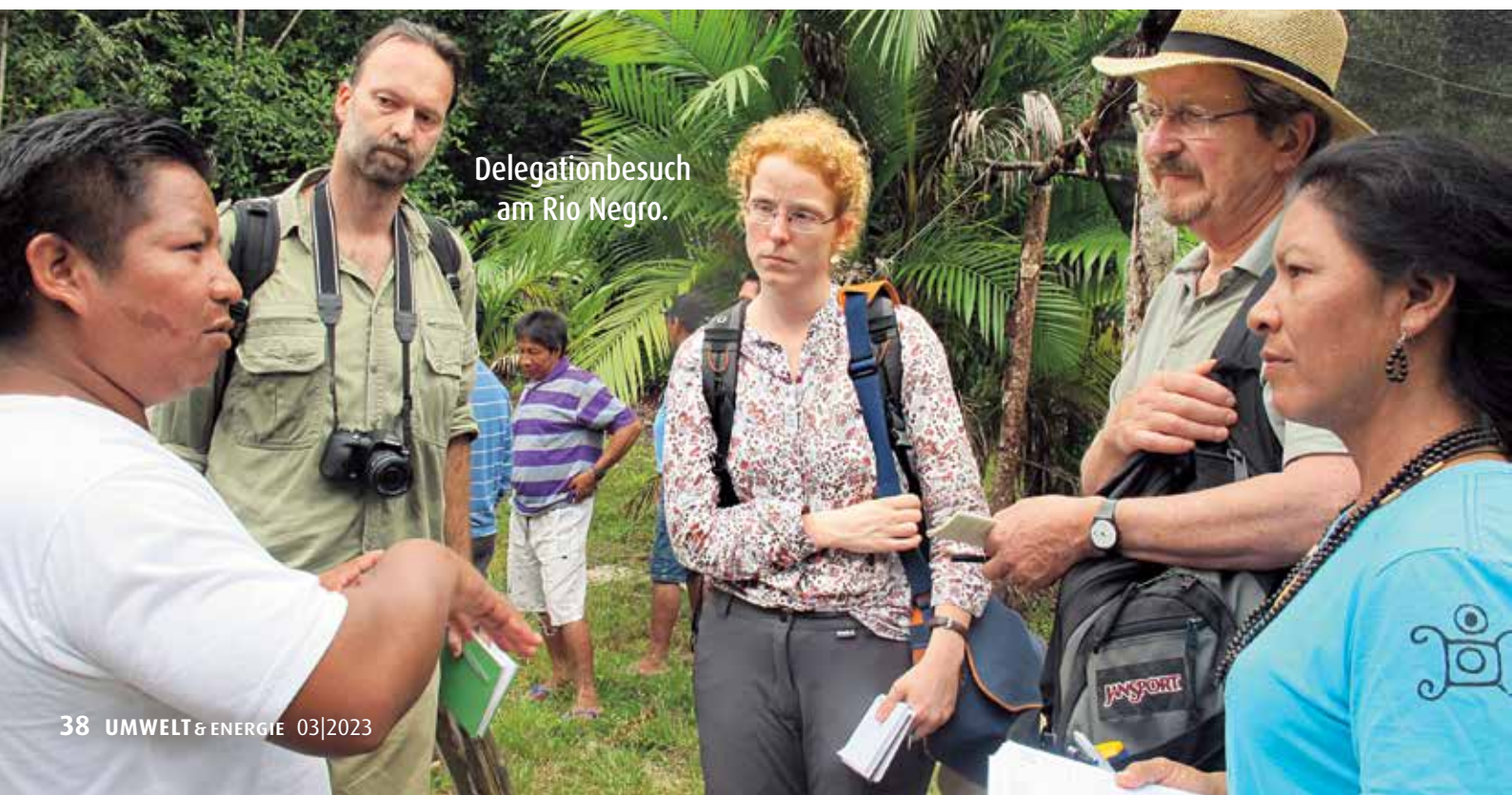
Delegationbesuch am Rio Negro.