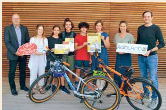
Die aktivste BikeRider-Klasse 2023 war die 5m des BG/BRG Keimgasse in Mödling.