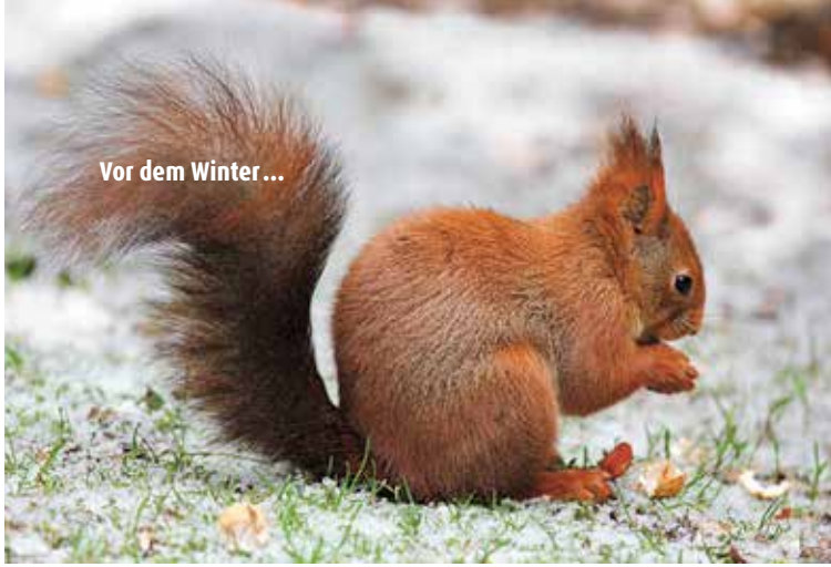
Vor dem Winter...