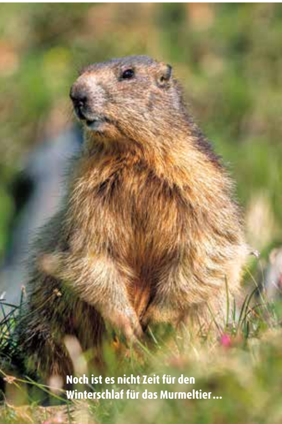
Noch ist es nicht Zeit für den Winterschlaf für das Murmeltier...