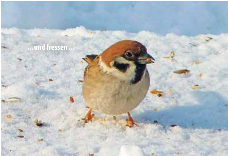
... und fressen ...